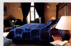
La suite "Jean Reno"