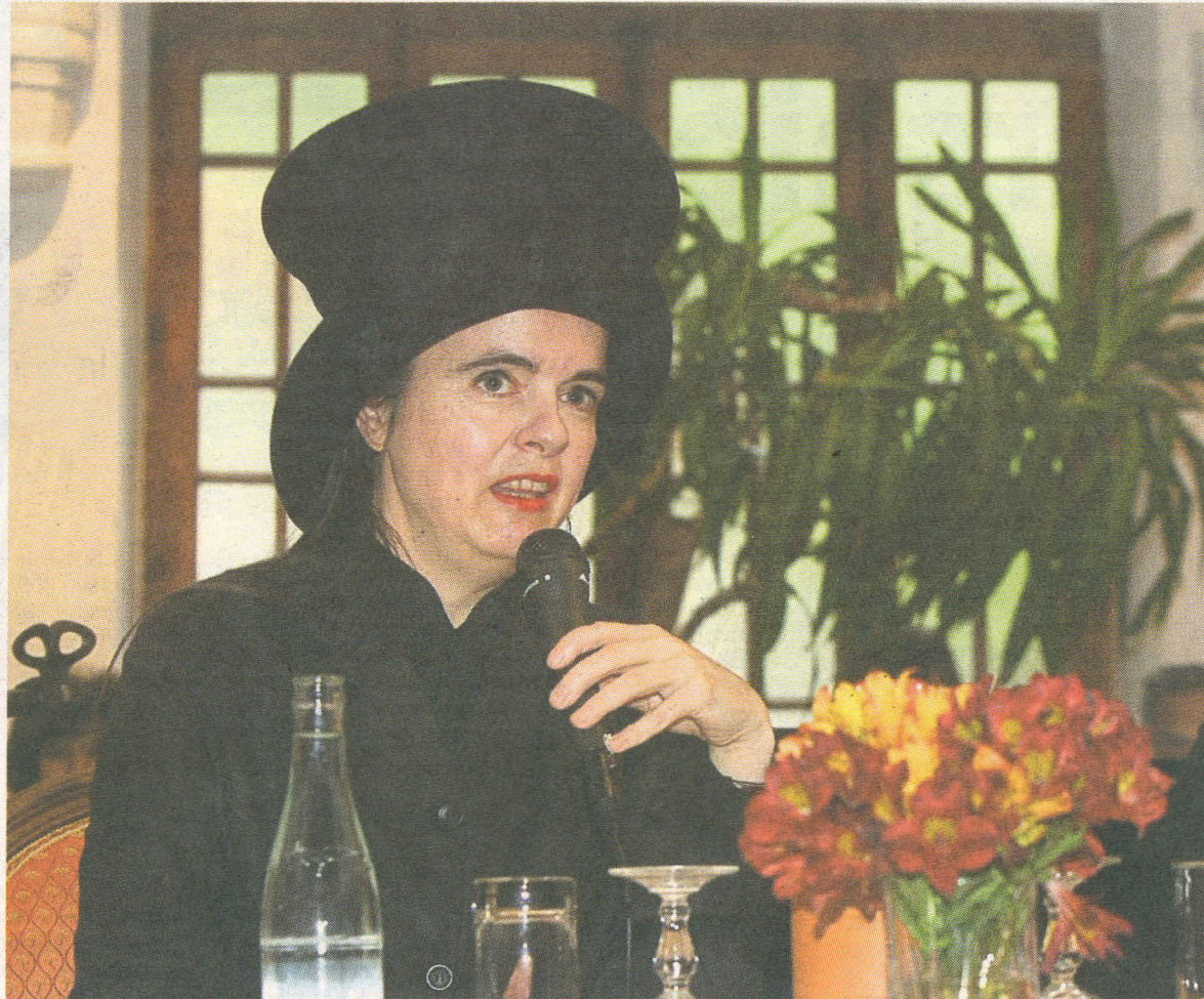
TALLOIRES, HIER. Au festival de Talloires, Amélie Nothomb a participé à un débat sur l'anorexie, un sujet que la romancière traite dans son nouveau roman, « Une forme de vie ».

Lors du débat auquel s'est prêtée Amélie Nothomb, l'affluence a été telle que la direction de l'hôtel a dû bloquer l'escalier qui conduisait au premier étage. Anorexie et boulimie ont été les mamelles de cet échange surchauffé. Un sujet que la romancière traite dans son nouveau roman